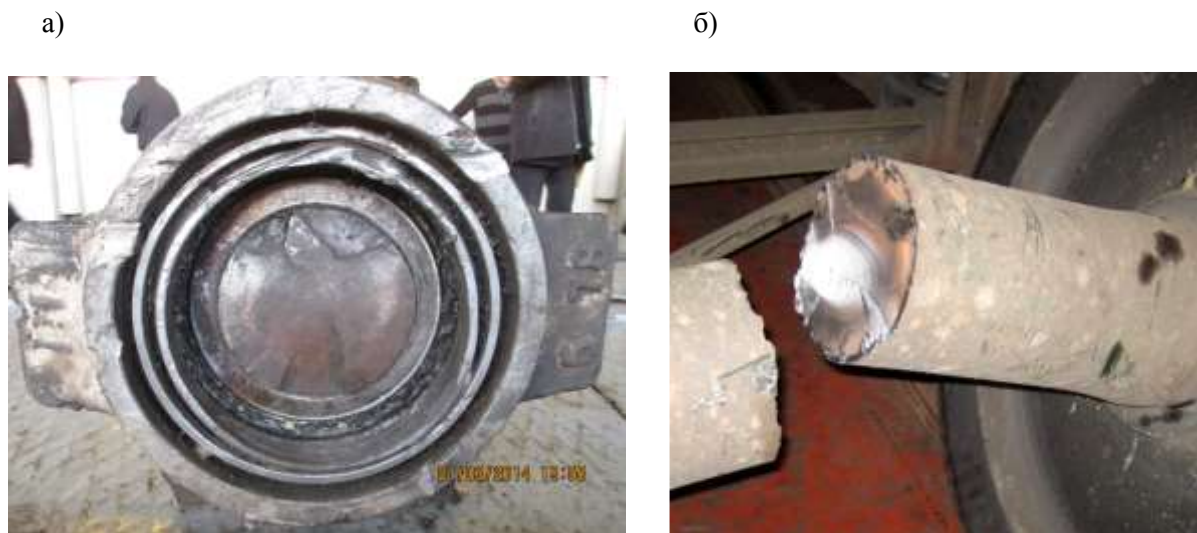
Рис. 1. Зломи осей колісної пари, що відбулися в холодному стані через зародження та розвиток утомлених тріщин: а) злом шийки в зоні лабіринтного кільця; б) злом в середній частині осі

Мікро- та макродефекти структури, накопичуючись в металі в процесі циклічного навантаження при розтягуванні, стисненні, вигині або крученні, мовби збирають і зберігають інформацію, пов'язану з максимальними величинами навантажень, які діяли на вісь, внаслідок чого структура металу виконує функцію своєрідного запам'ятовуючого датчика пікового значення сили [4].