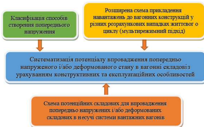
Рис. 1. Графічний вигляд взаємозв'язку між складовими

ний підхід) та потенційних складових для впровадження попередньо напружених і/або деформованих складових в несучі системи вантажних вагонів. Описане вище зручно подати в графічному вигляді (рис. 1).