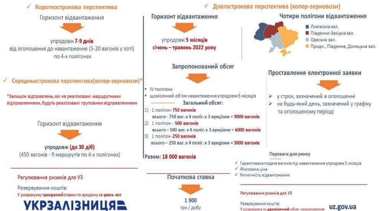
Рис. 3. Прогноз проведення продажу послуг з використання рухомого складу через систему Prozorro. Продажі