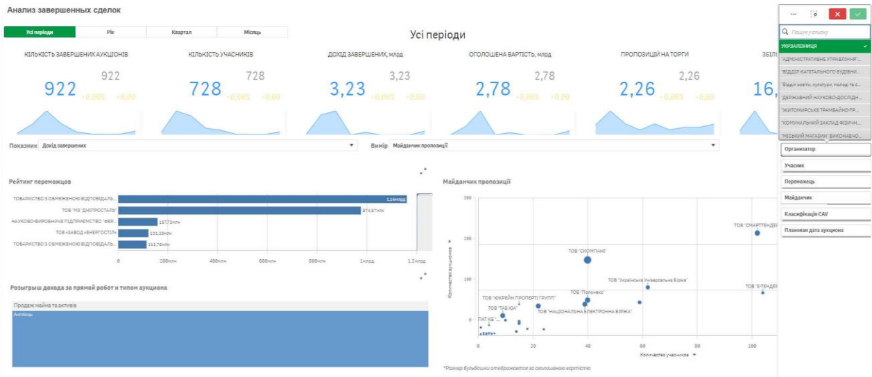
Рис. 2. Аналіз ефективності проведення аукціонів в системі ProzorGO.Продажі

«очікуваною» вартістю за оренду (користування) вагонами та «встановлену» вартість у сегменті напіввагонів склала 4,8 млн грн. Середня аукціонна вартість склала 1047 грн за один напіввагон на добу, що підвищило базову ставку на 28 % [4].