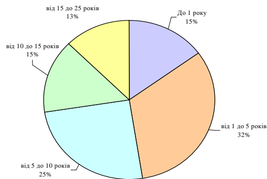
Рис. 4 - Розподіл транспортних подій за стажем роботи працівників

Формування мети роботи. Одним з найбільш перспективних і сучасних заходів підвищення безпеки на залізничному транспорті як зазначалося у попередніх розділах є впровадження автоматизованих засобів підтримки прийняття рішень для оперативного персоналу залізничних підрозділів. Але при розробці та впровадженні зазначених систем практично не приділяється уваги оцінюванню якості роботи чергового по станції в існуючих умовах та в умовах функціонування автоматизованих робочих місць. Згідно до зазначеного можливо сформувавши мету даної наукової роботи – формування параметру безпечного управління поїзною роботою на залізничній станції.