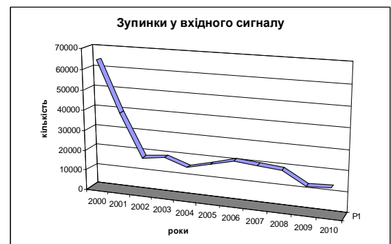
Рис. 1 - Аналіз кількості зупинок у вхідних сигналів

Широкий спектр, підвищена складність та наявність одразу декількох певних з