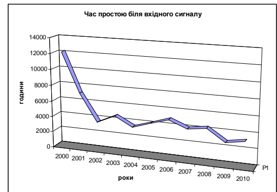
Рис. 2 - Аналіз часу простою поїздів у вхідних сигналів