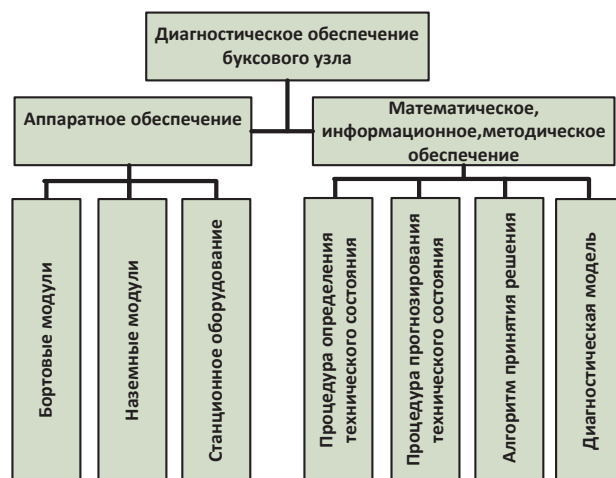
Рис. 1. Структура диагностического обеспечения буксового узла вагона

Структура диагностического обеспечения буксового узла для современных вагонов приведена на рис. 1.