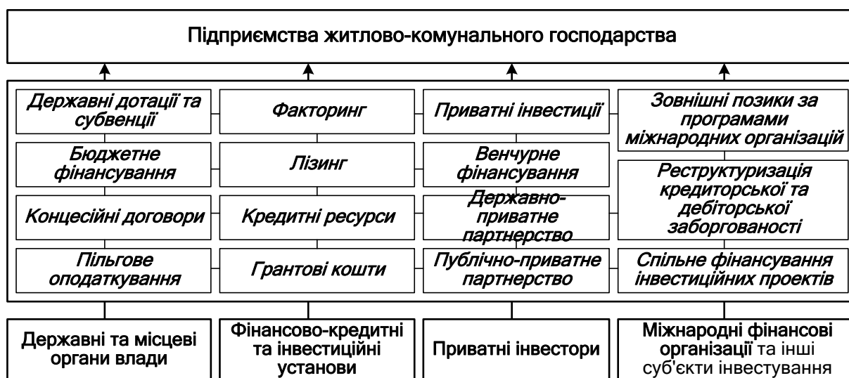
Рис. 2. Інструментарій інвестиційного забезпечення розвитку підприємств житлово-комунального господарства

Таким чином, ґрунтуючись на наукових здобутках у сфері фінансово-інвестиційного розвитку підприємств, доцільно виділити такі інструменти інвестиційного забезпечення підприємств житлово-комунального господарства: державні дотації та субвенції; бюджетне фінансування; концесійні договори; пільгове оподаткування; факторинг; лізинг; кредитні ресурси; грантові кошти; приватні інвестиції; венчурне фінансування; державно-приватне та публічно-приватне партнерство; зовнішні позики за програмами міжнародних організацій; реструктуризація кредиторської та дебіторської заборгованості; спільне фінансування інвестиційних проектів тощо (рис. 2).