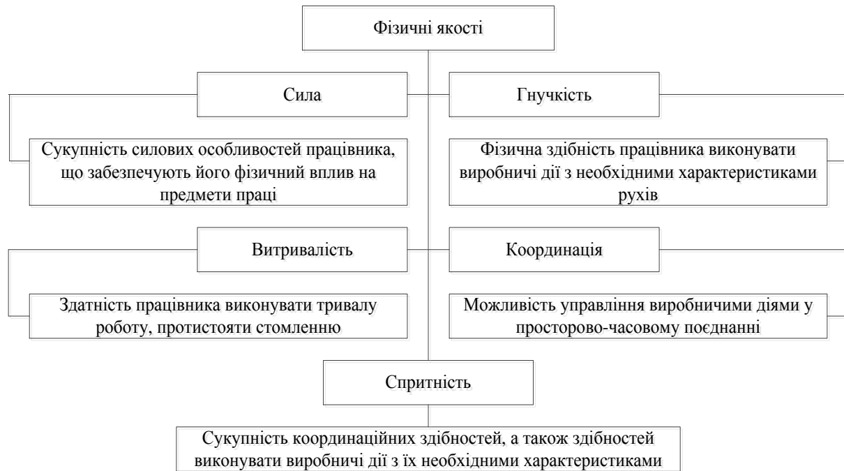
Рис. 3. Фізичні характеристики дій працівників

До емоційних якостей працівника відносяться його реактивність, збудливість, аффективність, експресивність.