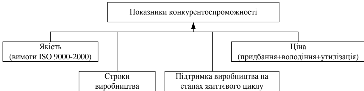
Рис. 2. Показники конкурентоспроможності продукції [14]

Показники конкурентоспроможності продукції на рівні виробів підприємства, як загальна міра задоволеності, прихильності й лояльності клієнтів до продукції підприємства може бути зведена до наступних основних показників (рис. 2).