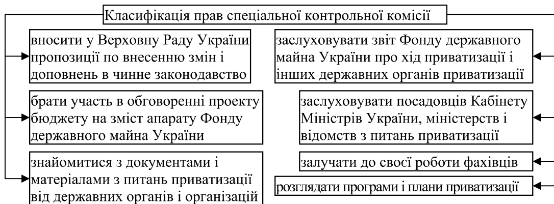
Рис. 1.3. Класифікація прав спеціальної контрольної комісії