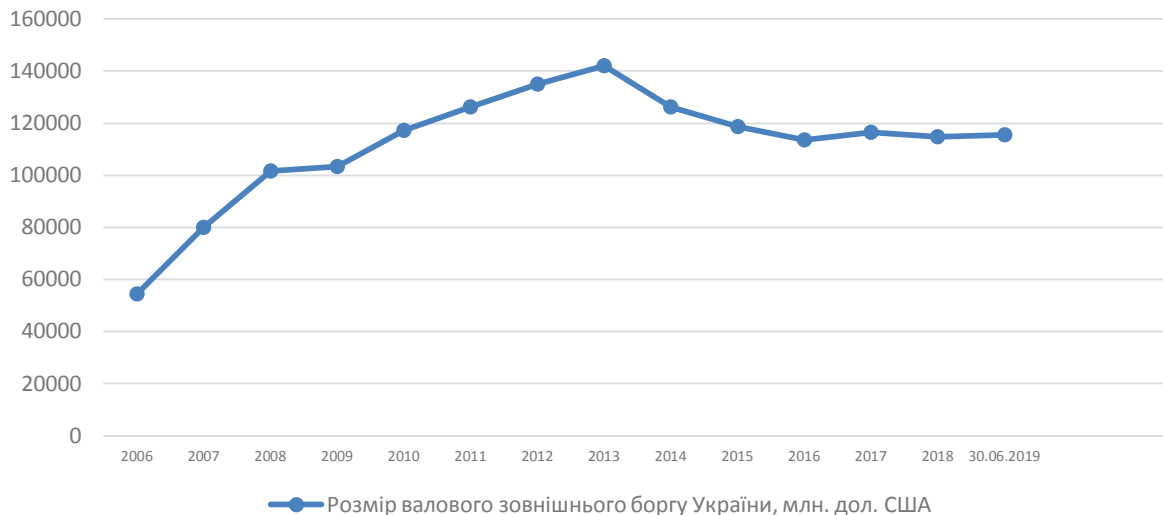
Рис. 1. Динаміка валового зовнішнього боргу України, млн. дол. США

Аналізуючи дані за 2006-2019 роки, можемо стверджувати, що цей показник значно перевищує нормативне значення, що може спричинити відплив з країни сукупних валютних резервів, передачу частини державної власності у власність зарубіжних країн, зниження міжнародного престижу країни, тобто рівень зовнішнього валового боргу безпосередньо позначається на рівні валютної безпеки.