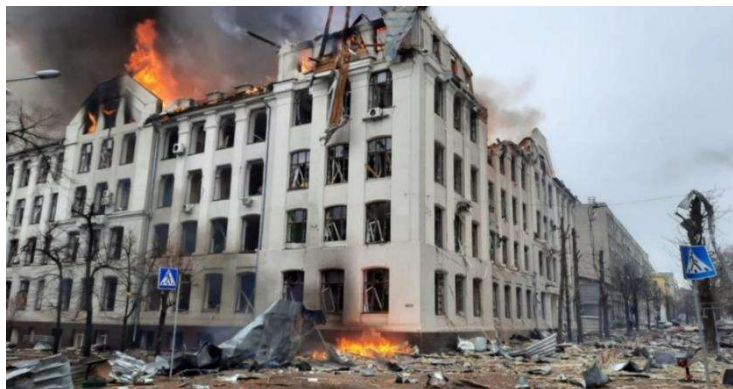
Рис. 1. Харківський національний університет ім. В. Н. Каразіна

На думку А. Даниленка, Г. Єршова «продовження воєнних дій знижує потенціал України для самостійного стійкого економічного зростання. Істотно збільшується державне боргове навантаження, знищуються виробничі потужності, а з ними і промисловий потенціал країни, знижуються можливості швидкого повернення більшості вимушених біженців з-за кордону» [1].