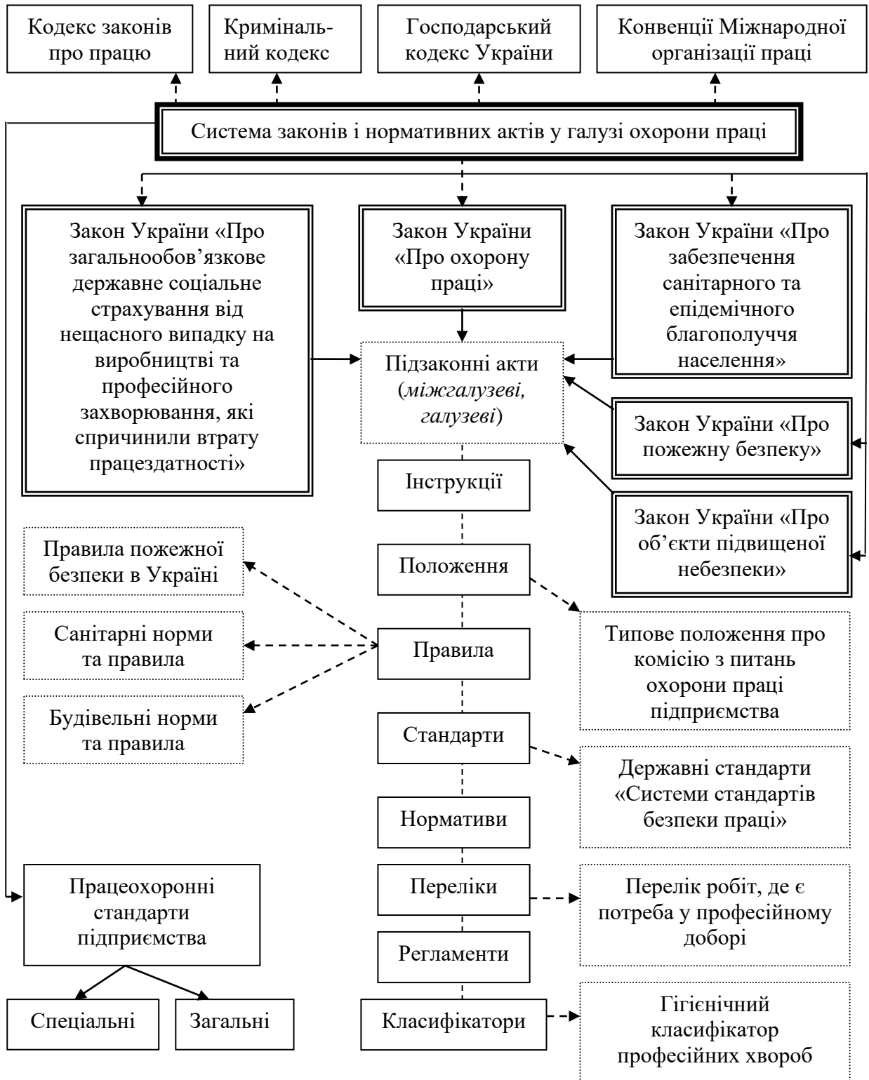
Рис. 1.1. - Блок-схема багаторівневості системи нормативних актів у галузі охорони праці

На рис. 1.1 наведена блок-схема існуючої в Україні системи нормативних актів у галузі охорони праці.