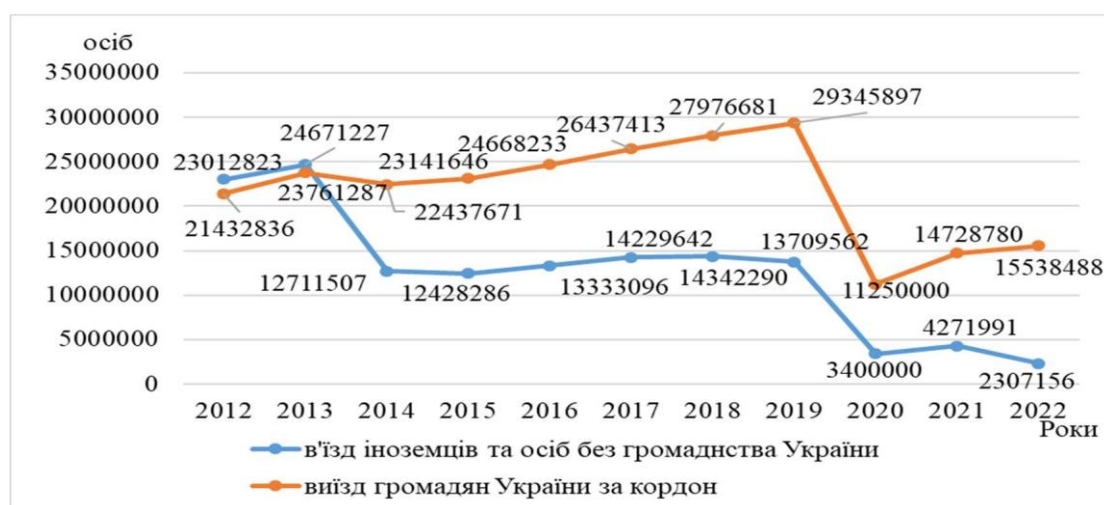
Рис. 1. Динаміка в'їзних та виїзних туристичних потоків протягом 2011-2022 років [11-12]

особами в більшості для пошуку безпечного місця перебування. Діловий туризм реалізується виключно за рахунок відвідувань країни міжнародних партнерів задля підтримки нашої держави в умовах воєнних дій.