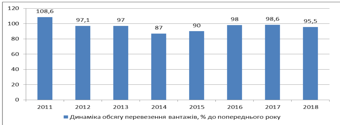
Рис. 1. Динаміка обсягу перевезень вантажів за 2011 – 2018 рр. (складено на основі [12])