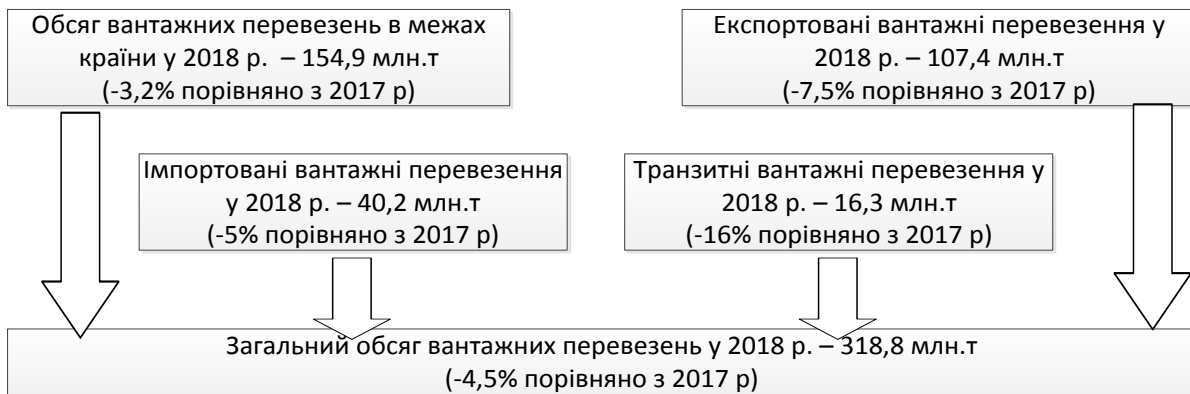
Рис.2. Вплив факторів на загальний обсяг вантажних перевезень (складено на основі [12])

В цілому 2018 рік ознаменувався дефіцитом і погіршенням операційних показників роботи локомотивної тяги, що значно вплинуло на зниження залізничних вантажоперевезень у країні в цілому.