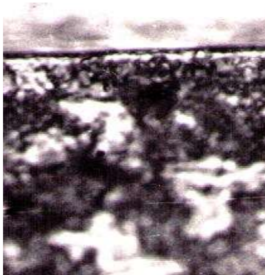
Рисунок 2 – Покрытие на поверхности колеса

после изотермической выдержки, охлаждения и механической обработки осуществляется термообработка колес, заключающаяся в упрочнении обода колеса. Однако, технология термической обработки колес не регламентирует прокаливаемость, обеспечивая неравномерную, убывающую твердость по сечению обода. Таким образом, существующая технология изготовления колес после термообработки обеспечивает получение на ободу колес структуры тонкопленчатого перлита с твердостью на глубине 30 мм от поверхности катания менее 255 НВ. Поэтому