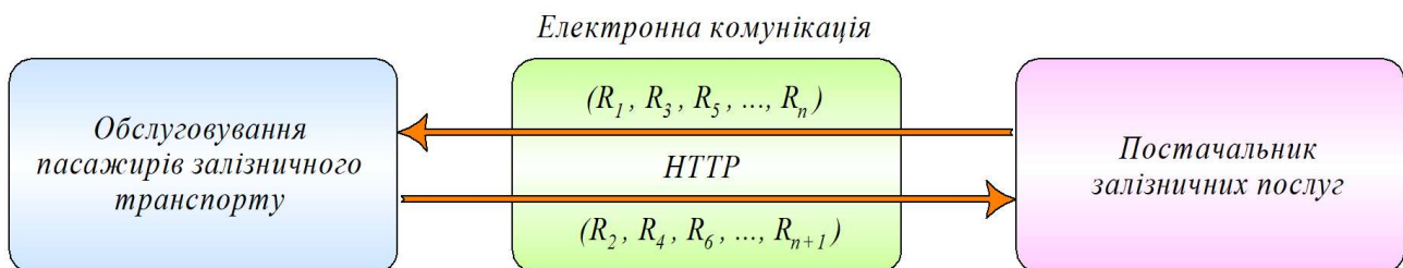
Рис. 2. Комунікація між службами в моделі ІТ-транзакцій

Сервіс моделі транзакцій визначається на основі взаємної комунікації, що представляє здатність сервісу реалізувати електронний процес обміну повідомленнями та взаємодії, що відображається в здатності користувачів та ІТ-адміністраторів реалізувати комунікацію, як наведено на рис. 2.