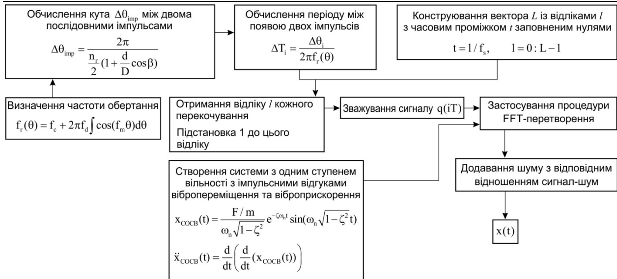
Рис. 1. Схема числової реалізації розглянутої методики

Обрані параметри моделі вібраційного сигналу роликового підшипника кочення передньої кришки тягового редуктора електропоїзда ЕР2Т для трьох видів пошкоджень наведені в табл. 1, а результати моделювання – на рис. 2.