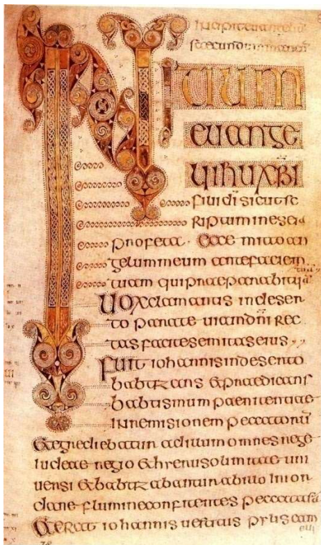
Рис.3. Євангеліє з Дарроу

Євангеліє з Ехтернаху – ілюмінований рукопис Євангелія з монастиря Ехтернах, створений в Ірландії у 690-715 роках. Як і в книзі з Дарроу, євангелісти в Ехтернахском манускрипті представлені скоріше символами, ніж портретами. Зображення святого Матвія найбільш схематично: його тіло складається з петель, з яких висовуються бліда голова і маленькі ноги. У довгих руках він тримає розкритим своє Євангеліє, початкові слова якого ясно читаються. За святим знаходиться стилізований трон. Смугастиий орнамент навколо, в чомусь схожий з орнаментами книги з Дарроу, утворює разом із зображенням святого хрест.