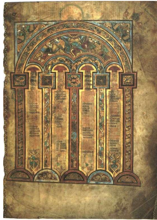
Рис. 8. Канонічна таблиця з Келльської книги