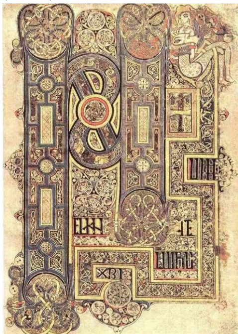
Рис.1. Початок Євангелія від Марка. Келлська книга

плетеним кельтським орнаментом, в нетрях якого причаїлися дивовижні звірі і птахи (Рис.2).