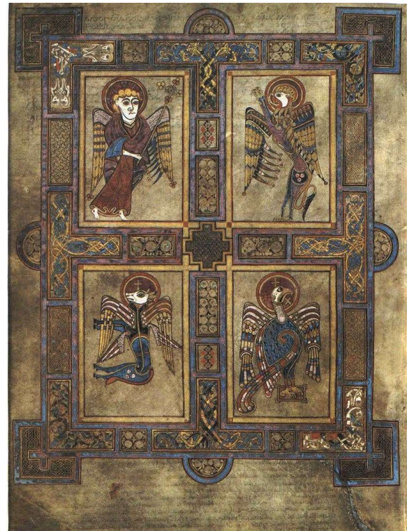
Рис. 6. Келлська книга. Символи Євангелістів

Повторюючи традиційний тип колонного портика, таблиці Келлської книги створюють вражаючі за багатством фантазії форми. Тимпани над колонами заповнені стилізованими символами євангелістів. Спіралеподібні орнаменти і плетіння покривають і стовбури лінійно окреслених колон з умовно позначеними у вигляді квадратів капітелями і розгорнутими на площині листа круглими підставами баз, також прикрашеними орнаментом [4, р. 105] (Рис. 8).