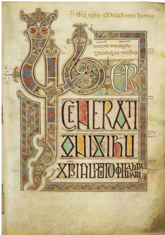
Рис. 5. Євангеліє з Ліндісфарну