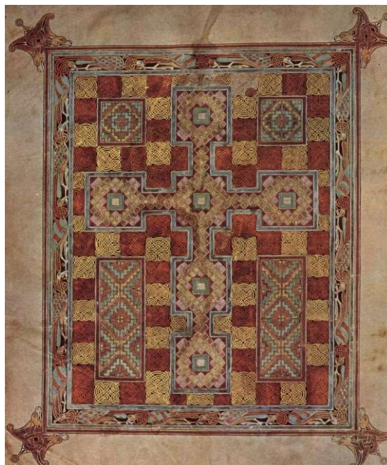
Рис.2. Килимова сторінка Євангелія з Ліндісфарну

Плетені і спіральні візерунки, за задумом їх творців, мали, крім художньої, ще й важливу охоронну функцію. Кельтське язичництво наділяло такі орнаменти, що символізують чи то переплетення гілок в священних галях, то чи бурління спінених хвиль, здатністю відводити лихе око і нейтралізувати чаклунські чари. Килимові сторінки нібито охороняють священний текст від зазіхань сил Хаосу. Згідно з іншою гіпотезою, килимові сторінки є образотворчими алюзіями на багато оздоблені дорогоцінні скриньки – книжкові релікварії.