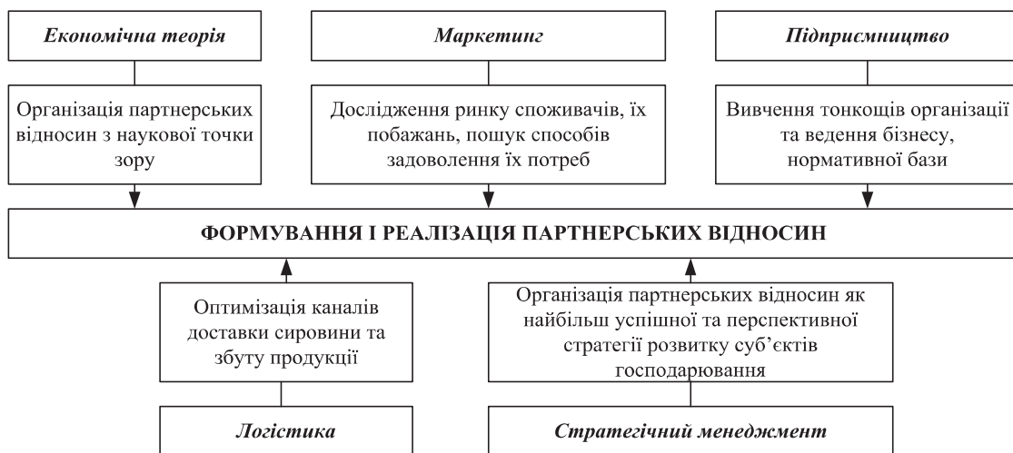
Рис. 1. Процес формування і реалізації партнерських відносин [5, с. 69]

Внутрішній рівень партнерських відносин транспортно-логістичного центру прикордонного регіону відбуває довгострокові взаємовигідні стосунки між учасниками транспортно-логістичного центру прикордонного регіону на умовах добровільності та рівності, спрямовані на збереження положення окремих його учасників на ринку транспортно-логістичних послуг шляхом перерозподілу участі відповідно до