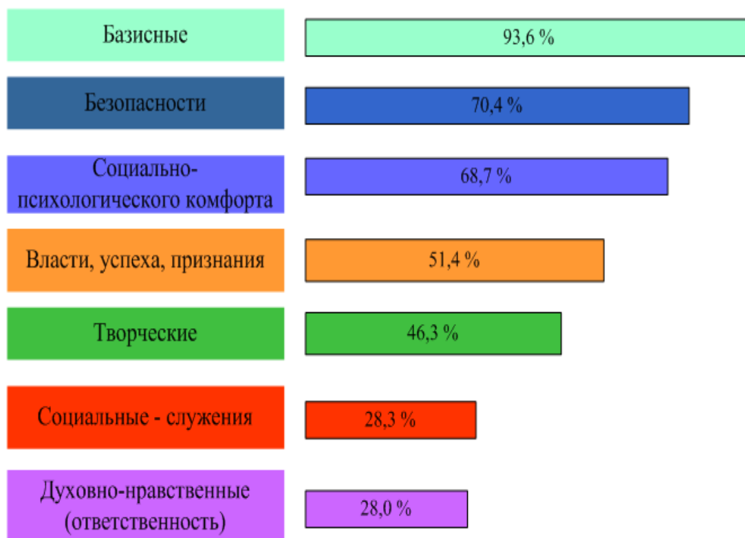
Рисунок 9.3 – Пирамида потребностей, реализуемых в труде, по данным WVS, 1999 г.

Опросы показали, что для менеджеров уровень КТЖ в целом соответствует средней степени удовлетворенности, а вот для работников структурных подразделений КТЖ соответствует низкому уровню (таблица 9.2). Для последних на низком уровне удовлетворены практически все потребности – от базовых и безопасности до творческих и духовно-нравственных [31].