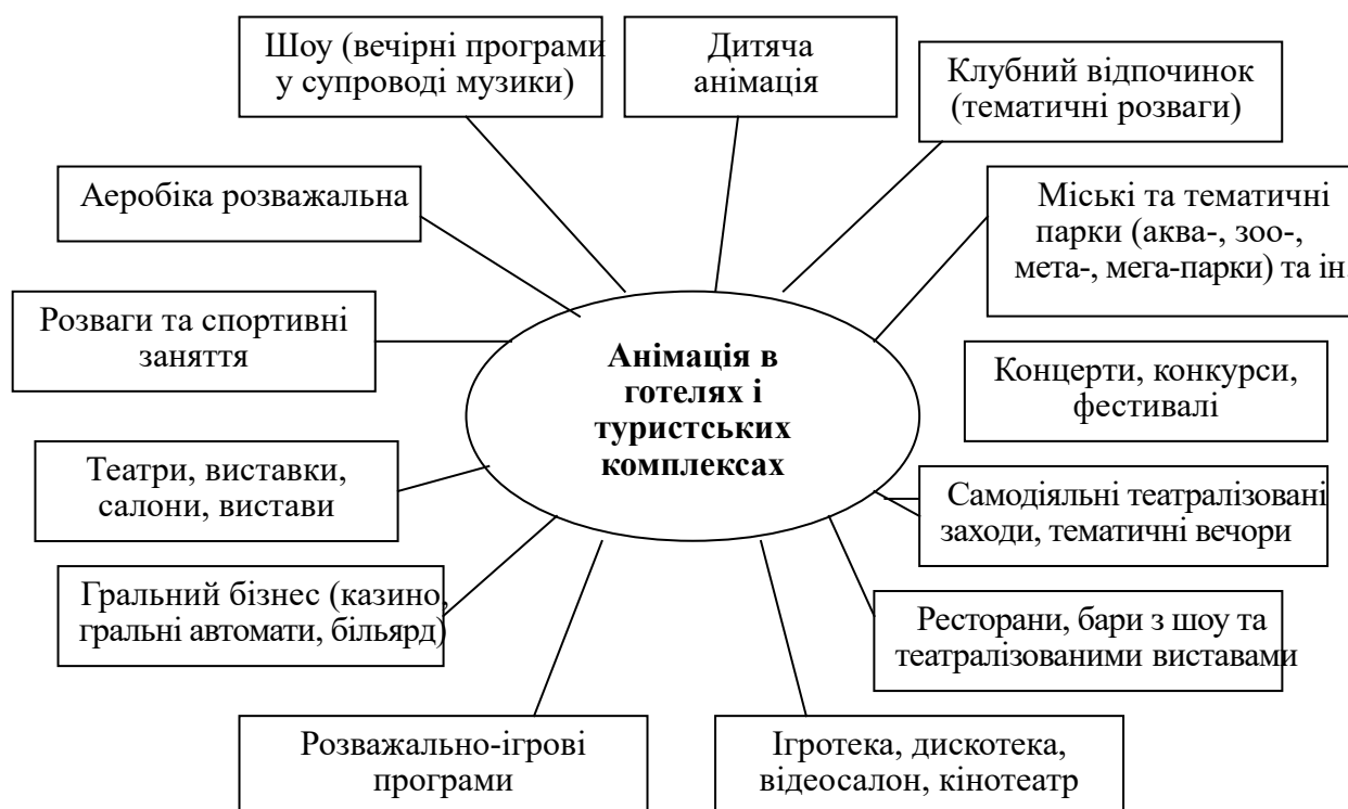
Рисунок 10.1 – Види анімаційних заходів у туризмі

Види анімаційних заходів подано на рисунку 10.1.