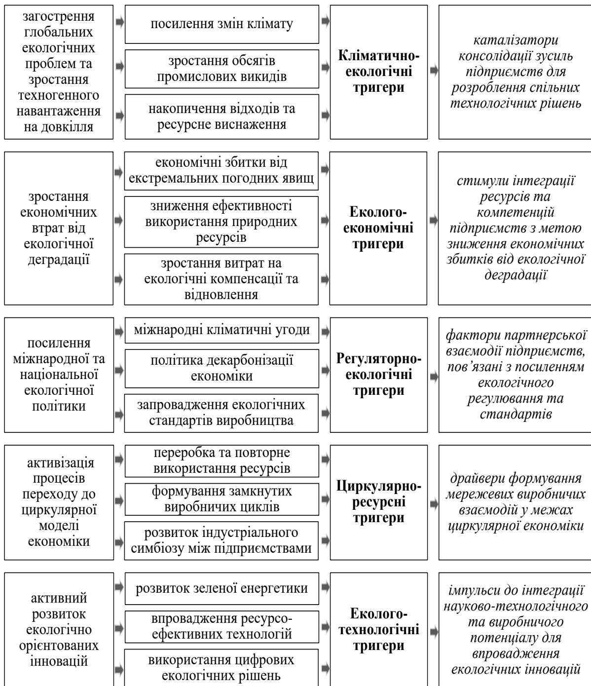
Рис. 1.3. Екологічні тригери розвитку інноваційно-індустріального партнерства бізнес-суб'єктів (розробка автора)

по-друге, еколого-економічні тригери, пов'язані зі зростанням економічних втрат від екологічної деградації, і проявляються в наростанні економічних збитків від екстремальних погодних явищ, зниженні ефективності використання природних ресурсів, зростанні витрат на екологічні компенсації