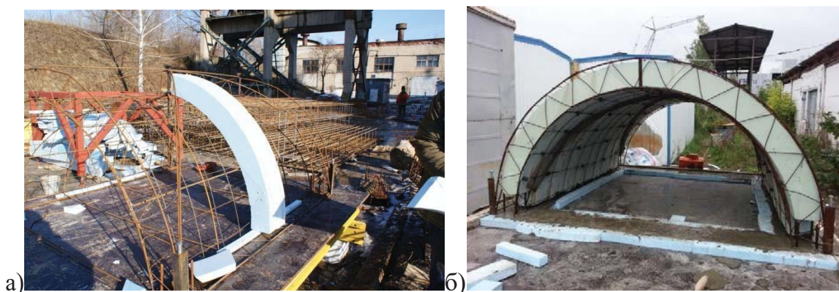
Рис. 1. Изготовление самонесущего остова: а) элемент вкладыша; б) конструкция остова

Целью данной работы является моделирование и технология создания внутренней несъемной опалубки для бетонирования криволинейных железобетонных облегченных конструкций системы «Монофант». При этом основной задачей является уменьшение отхода при раскрое плоского прямоугольного листа пенополистирола и максимальное уменьшение количества элементов в сорimente для изготовления вкладыша.