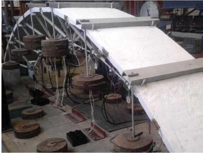
Рис. 1. Дослідний зразок на стадії випробування

Дослідний зразок завантажувався металевими вантажами. Для цього було розроблено та виготовлено систему траверс, яка складалася з перекладини і двох штанг. На штанги нанизувалися металеві вантажі. Траверси укладалися перекладиною на верхній пояс конструкції. Завантаження дослідного зразка здійснювалося ступінчасто у декілька стадій. Згідно методики експериментальних досліджень конструкція досліджувалася на дію експлуатаційного навантаження (70 % від несучої здатності), тобто руйнування конструкції не ставилося за мету (рис. 1).