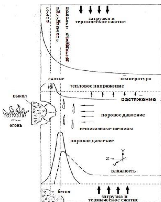
Рис. 1. Взрывное отслаивание бетона под воздействием поровых давлений и термических напряжений

При таком подходе система уравнений (1) - (3) распадается на отдельные дифференциальные уравнения, каждое из которых решается последовательно.