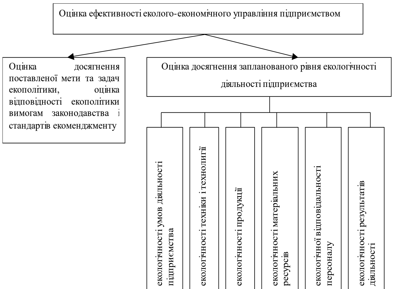
Рис.4. Оцінка ефективності еколого-економічного управління підприємством

Запропоновано підходи до визначення ефективності ЕЕУП, які дозволили проводити оцінку ефективності ЕЕУП шляхом використання якісних критеріїв і кількісних показників та визначення ступеня досягнення цілей, задач екополітики запланованого рівня екологічної діяльності (рис. 4).