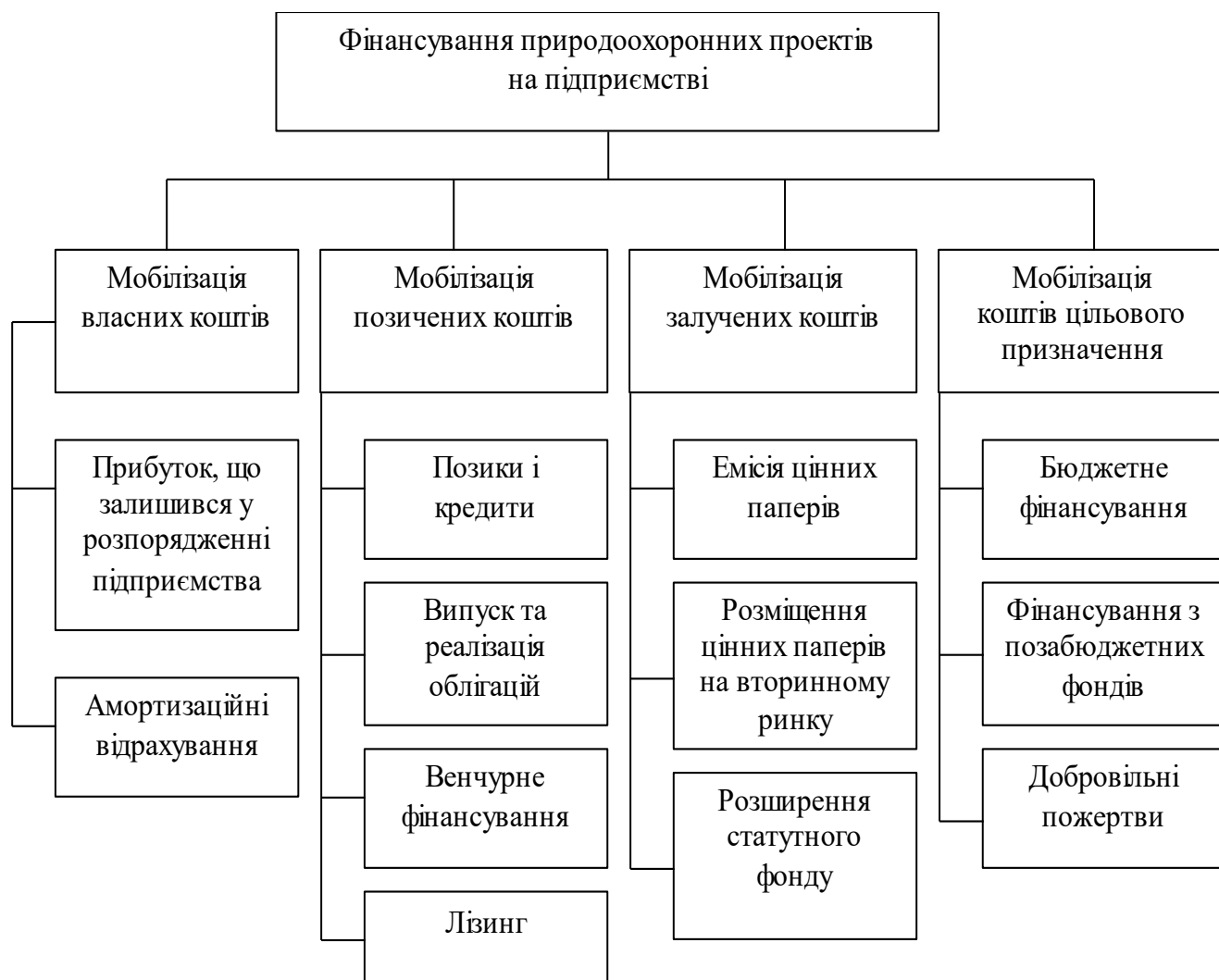
Рис. 1. Фінансування природоохоронних проектів на підприємстві

В роботі запропоновано виділяти такі групи мобілізації коштів для фінансування природоохоронних проектів: власні кошти підприємств, позичені кошти, кошти, що залучені та кошти цільового призначення (рис. 1).