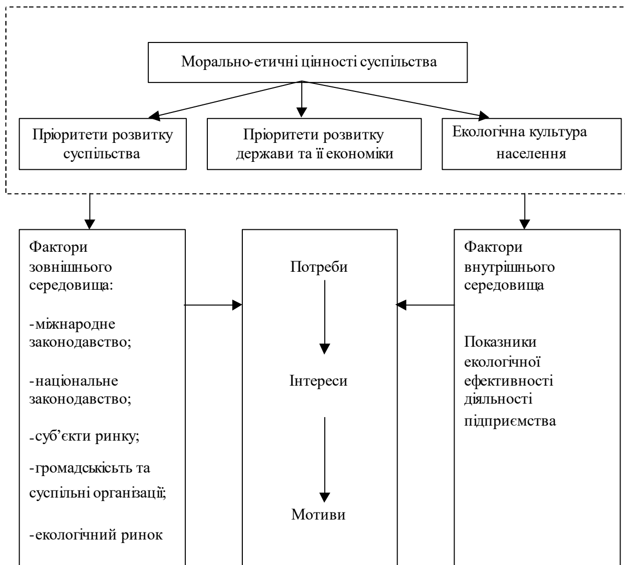
Рис. 2. Механізм мотивації розбудови системи ЕЕУП

- створюється сприятливий імідж підприємства серед населення і громадськості.